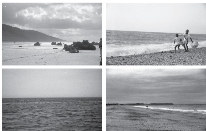
Fragments extraits de la Bibliothèque du Bord du Monde , empruntés par les étudiantes.