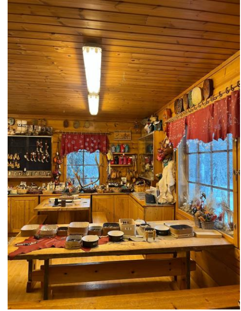
Des sorties terrain organisées dans la forêt, au musée, visite du centre-ville et des lieux clés de l'histoire de la ville, visite d'un atelier de créations artisanales tenu par des populations Sámi, sortie au Village du Père Noël, sortie dans la neige pour analyser le manteau neigeux...

Des portes-manteaux sont à disposition dans le hall pour y laisser nos affaires pendant la journée