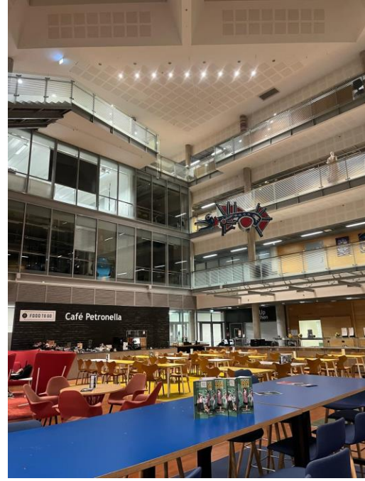
2 cafétérias : 2,95€ le repas

Les espaces communs de l'université (bibliothèque, cafétérias...) sont ouverts 24h/24, 7j/7 grâce à un badge d'accès sur une application mobile