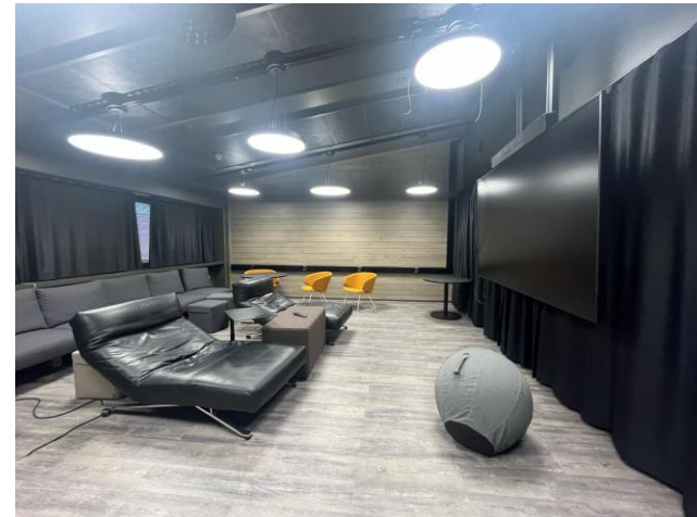
Salles de travail que l'on peut réserver dans la bibliothèque, et même une salle de cinéma